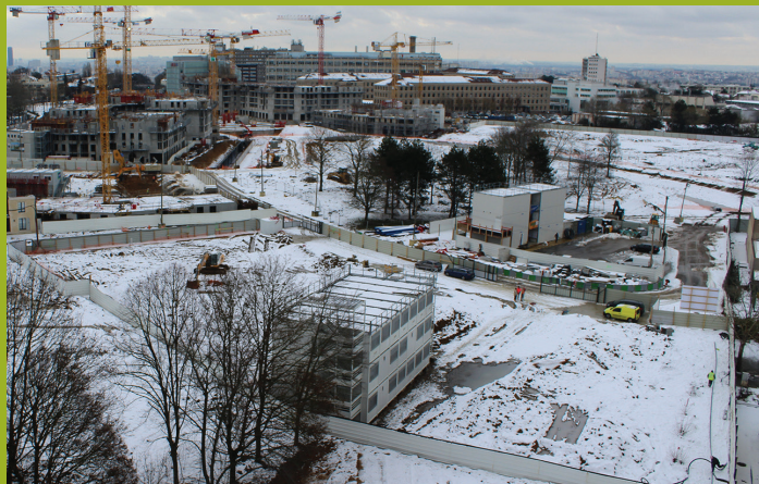
1 er janvier 2019