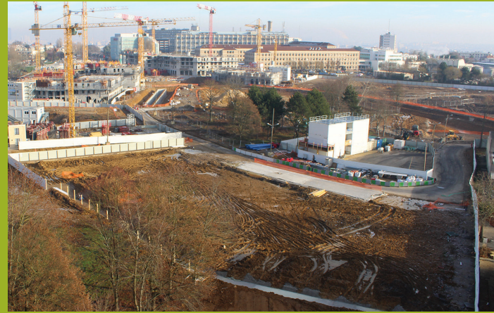
25 novembre 2018