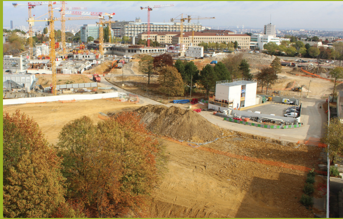
26 septembre 2018

Depuis la rentrée 2018, le nouveau quartier du Panorama prend forme : plan d'eau terrassé, travaux de la contre-allée du Général de Gaulle, réalisation du parking souterrain et démarrage des travaux d'aménagement de la place. Les constructions se poursuivent avec certains lots clos et couverts, le démarrage des lots de la tranche 2 et du groupe scolaire.