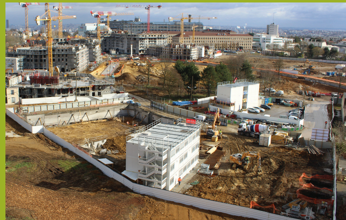
2 février 2019