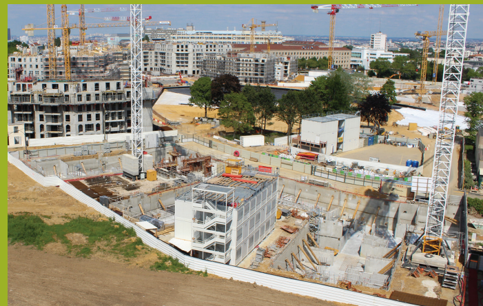
1 er mai 2019