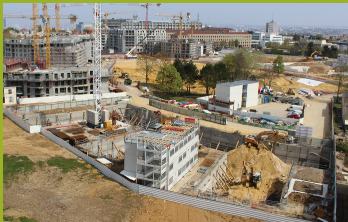
16 mars 2019