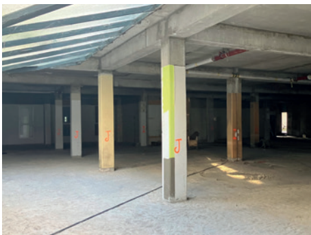
Coque Carrefour curée

Création de la future coque Monoprix : dans la continuité des travaux de curage réalisés cet été, la dépose des dernières façades a lieu afin de pouvoir construire la future coque. Nous amènerons également les différents réseaux nécessaires au fonctionnement du commerce.