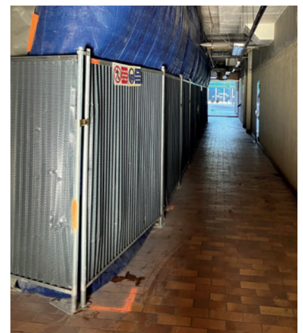
Travaux en demi couloir

Création d'une nouvelle circulation publique assurant la liaison entre la Place de la Source et la rue Paul Vaillant-Couturier face au marché du Troisy. Le sol sera en pierre de luserne afin d'assurer une homogénéité des espaces publics. L'accessibilité de cette circulation sera réalisée par la pose de deux ascenseurs « PMR ».