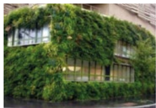
Toitures et façades entièrement végétalisées

EN PLUS DE L'ATTENTION PARTICULIÈRE PORTÉE À LA BIODIVERSITÉ DANS LE CADRE DE LA CERTIFICATION EFFINATURE, DE NOMBREUSES ACTIONS SONT MISES EN ŒUVRE VISANT À INSÉRER LE PROJET DANS L'ÉCRIN DU BOIS DE CLAMART :