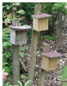
Intégration d'abris pour la faune