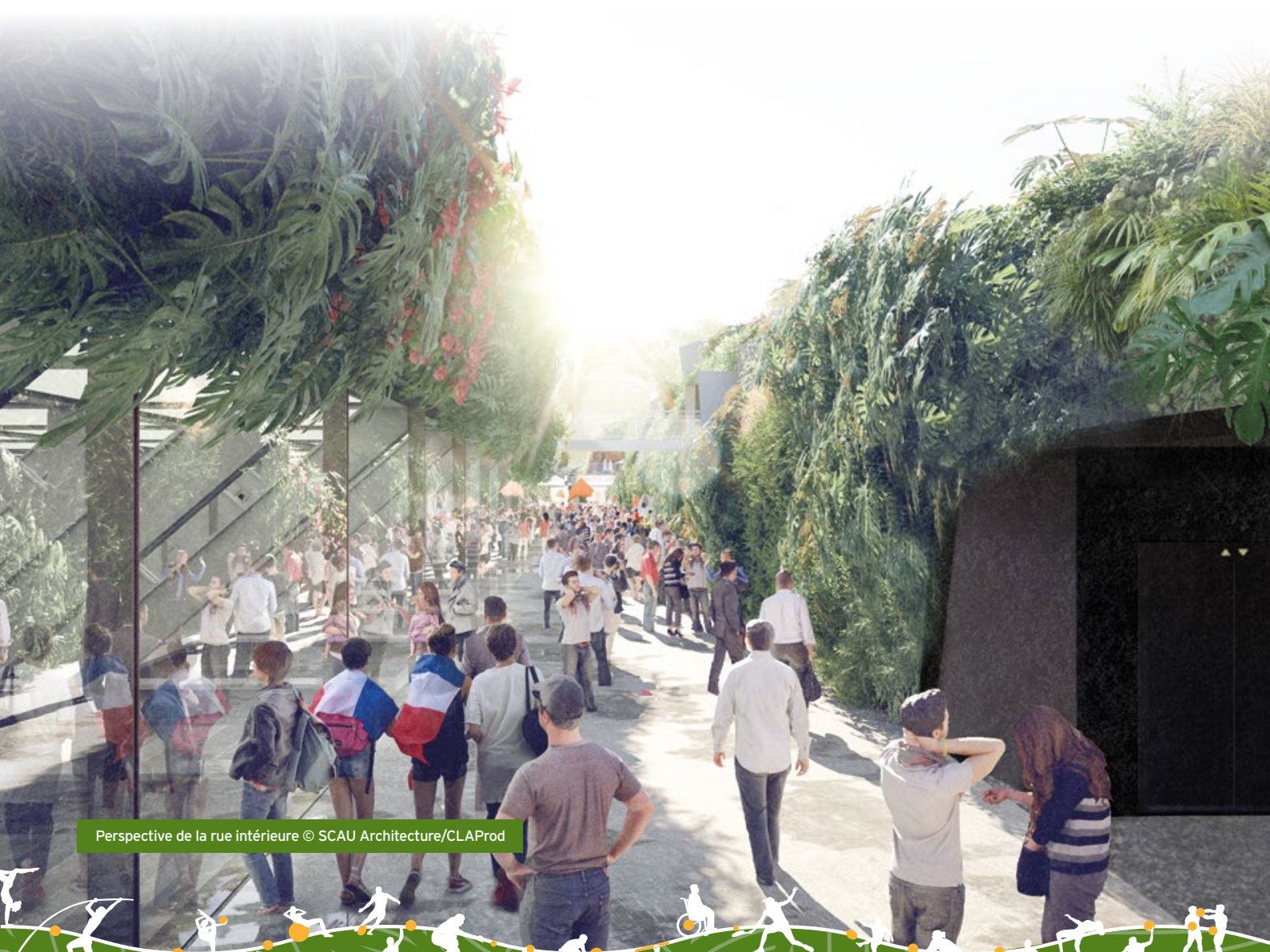
Perspective de la rue intérieure © SCAU Architecture/CLAProd

Panneaux solaires thermiques, toitures et façades végétalisées, remploi de la terre excavée, gestion des eaux pluviales par une noue paysagère... : cette deuxième édition du journal est consacrée à la haute qualité environnementale apportée au projet.