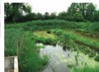
Gestion des eaux pluviales par une noue paysagère à ciel ouvert