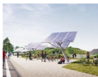
8 arbres avec panneaux solaires couvrant 80% des besoins de production d'eau chaude