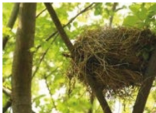
Respect de la période de nidification lors de l'abatage des arbres